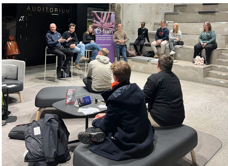
Vi ordnade en "Grilla en kristen" i Aulum vid en plats där många passerar.

Jag tror det var betydelsefullt att vi var inne i skolan, många kom och pratade med oss och vi kändes som "insiders", vilket inte är fallet i Helsingfors där vi