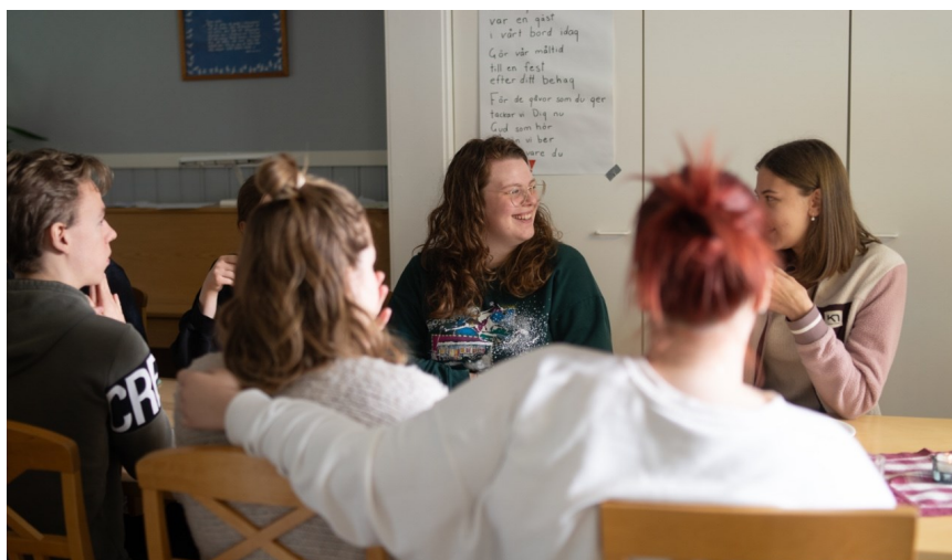
På höstweekenden diskuterade studerandena i smågrupper.

Under sommaren började vi vårt projekt. Vi hade en lista där någon bad varje dag och vi bad för olika föreningar olika dagar. Det blev ändå för tungt att fortsätta med det system vi hade, det rann ut i sanden efter ett par månader, så vid skolstarten satte vi oss ner och tänkte om. Vi ville be tillsammans, verkligen se varandra och lyfta upp böneämnen