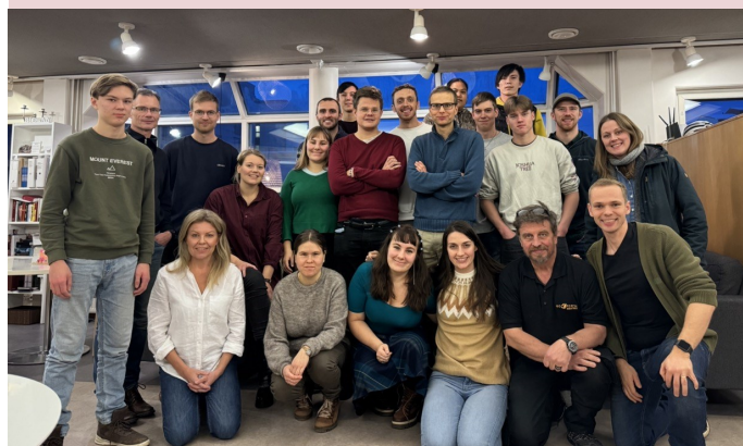
Gänget i Vasa består av både finsk- och svenskspråkiga och programmet är ofta tvåspråkigt.