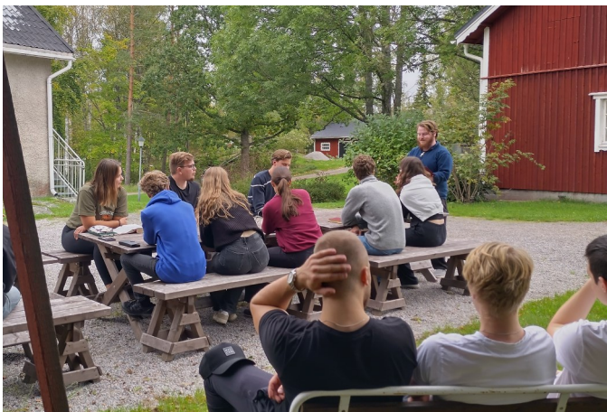
Helsingfors och Åbo ordnade gemensam höstweekend.