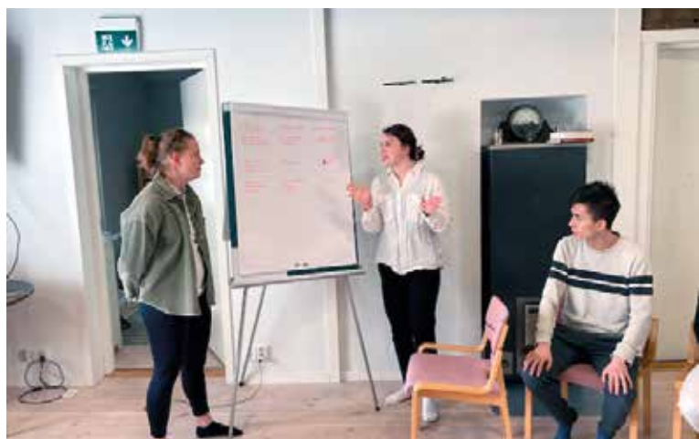
Team Åbo presenterar sina planer för följande läsår på coachningshelgen.