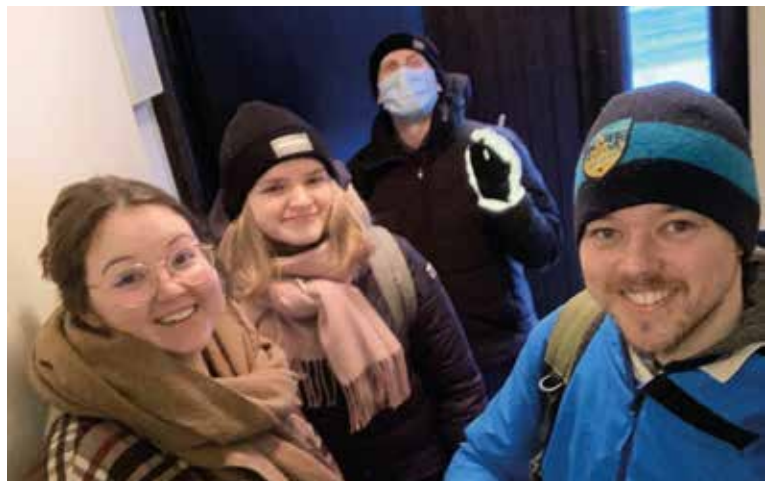
Vasa Studentmissionen gick ut varje tisdag kväll under hösten för att prata med studerande.

Vi hade ca 250 medlemmar i åldern 15-28 år. Helsingfors har gått upp på första plats med 106 medlemmar. Det finns