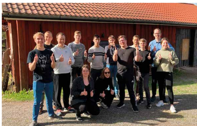
Styrelsemedlemmar från Åbo, Vasa och Helsingfors fick coaching i hur man kan utvärdera verksamheten och visionera framåt.