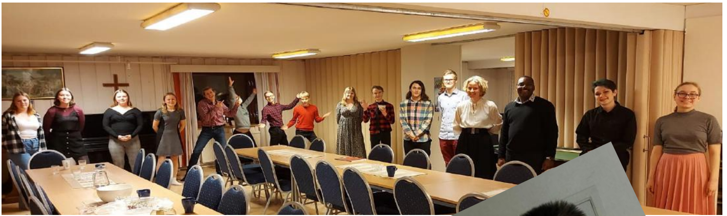
En del av gänget på Åland.