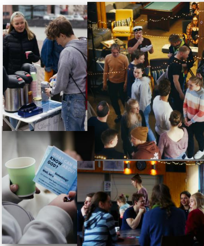
T.v. bilder från kaffeutdelningen och inbjudningarna. T.h. bilder från Cor-huset .

Arrangörerna HSSM och finska Studentmissionen i Helsingfors HOPKO mötte studerande med kaffe och inbjudan till evenemanget på campus under hela veckan. Det bjöds på flera måltider i Cor-huset under vilka samtal fördes och det fanns också tid för undervisning. Kvällarna inleddes med lek efter vilket det blev lovsång och undervisning. Undervisningen var tänkt att föra in de samlade på fortsatta samtal medan middagen serverades. Efter att ha träffats och samtalat flera gånger från onsdag till fredag, började relationer fördjupas och det som i