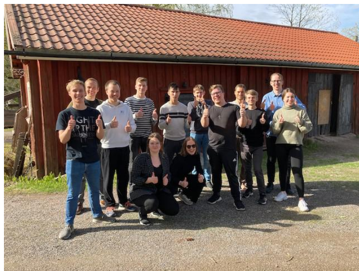
Ett inspirerat gäng som samlats på Enä-seppä. Vädret var gynnsamt!

Feedbacken efter styrelsedagarna var positiv och upplevelsen var att visionen/-rna för arbetet nu känns tydligare. Dagarna beskrevs av flera som sporrande och direkt praktiskt användbara. Bilden av det egna arbetet med dess styrkor och de saker som för tillfället uteblir blev starkare, löd respon-