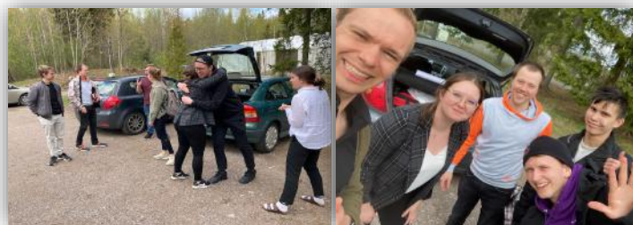
På återseende! T.v. ges avskedskramar, t.h. teamet från Vasa.

sen. En dröm inför dagarna var att styrelserna ska få känna att de är förberedda inför höstterminen och kan köra igång direkt, istället för att behöva en månad på sej att vea igång och komma på visionerna då det redan ofta är lite sent (läs: slutet av september). Styrelsedagarna gav en visshet om att det nu finns en plan för hur hösten körs igång i varje studiestad. Utrymme gavs också för att se längre in i framtiden — "var vill vi vara om 3 år?". Dagarna gjorde att styrelserna började känna sej som team, istället för att vara "bara" styrelser.