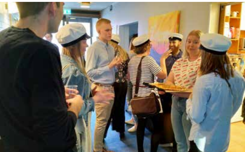
Åbo Studentmission firade vappen med en glad fest.