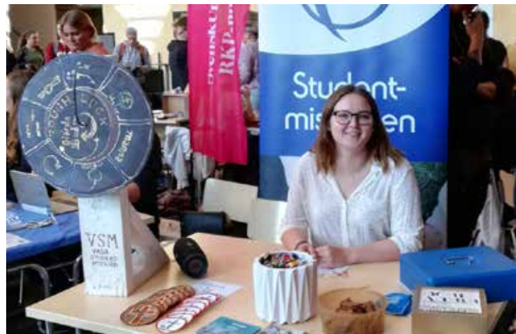
Vasa Studentmission presenterade sin verksamhet på föreningsmässan.

Under året befästes verksamheten i Jakobstad, där ett gäng på ca åtta studerande deltog i en ungdomsalphä på hösten. Vi höjde medlemsantalet i Helsingfors från ca 70 till 80. Vi satsade också på att öka inkomsterna för de olika arbetsområdena och det lyckades med Vasa, Jakobstad och Veritas Forum.