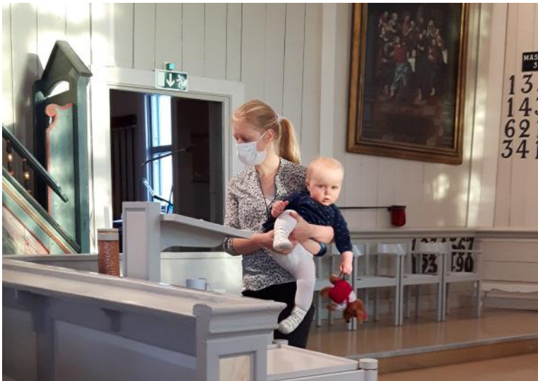
Gudstjänstens yngsta deltagare assisterade mamma vid bönen.