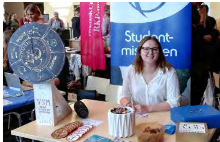
Vasa Studentmission presenterade sin verksamhet på föreningsmässan.

Under året befästes verksamheten i Jakobstad, där ett gäng på ca åtta studerande deltog i en ungdomsalphä på hösten. Vi höjde medlemsantalet i Helsingfors från ca 70 till 80. Vi satsade också på att öka inkomsterna för de olika arbetsområdena och det lyckades med Vasa, Jakobstad och Veritas Forum.