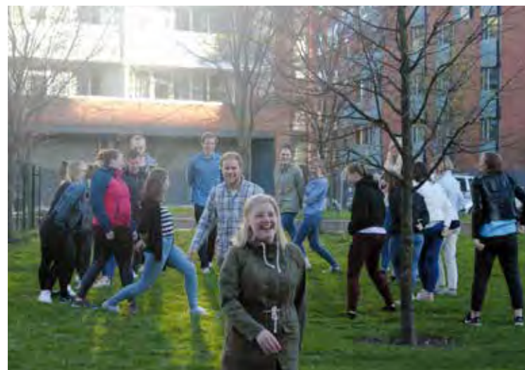
Sociala evenemang är viktiga i studentarbetet. Här på picknick med Helsingfors Studentmission.