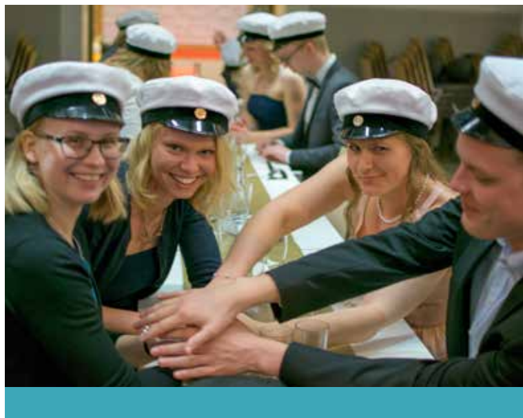
Vappfest i Åbo.