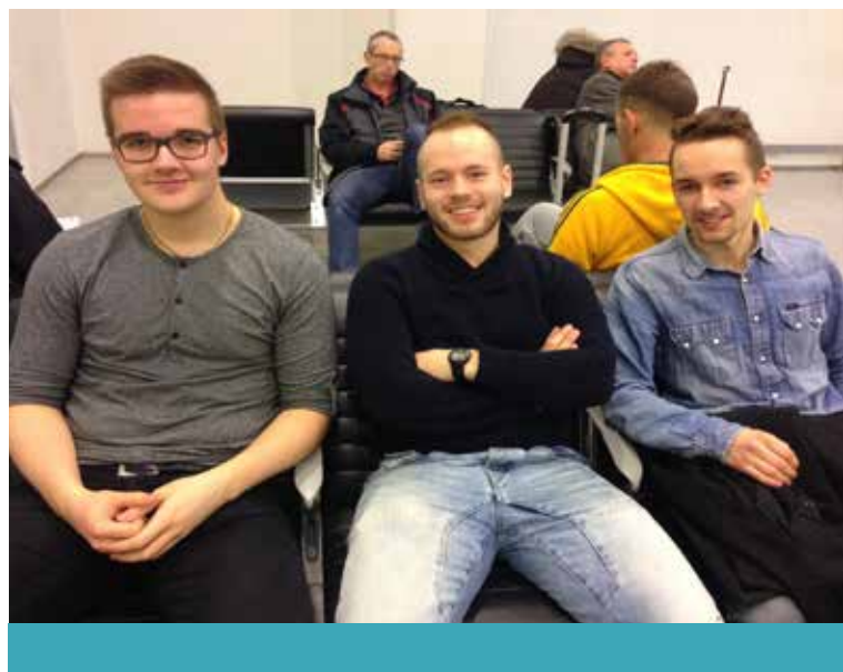
Studentarbetare på utbildningsresa till Sheffield.