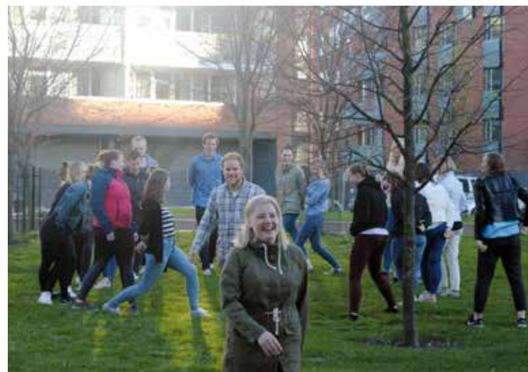
Sociala evenemang är viktiga i studentarbetet. Här på picknick med Helsingfors Studentmission.