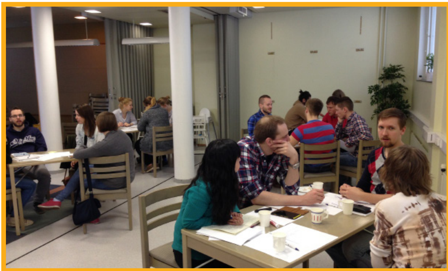
Diskussionsgrupper på PLC.