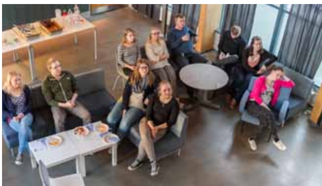
Några axplock från en Alpha-kväll i april på Cor-huset i Arcada.